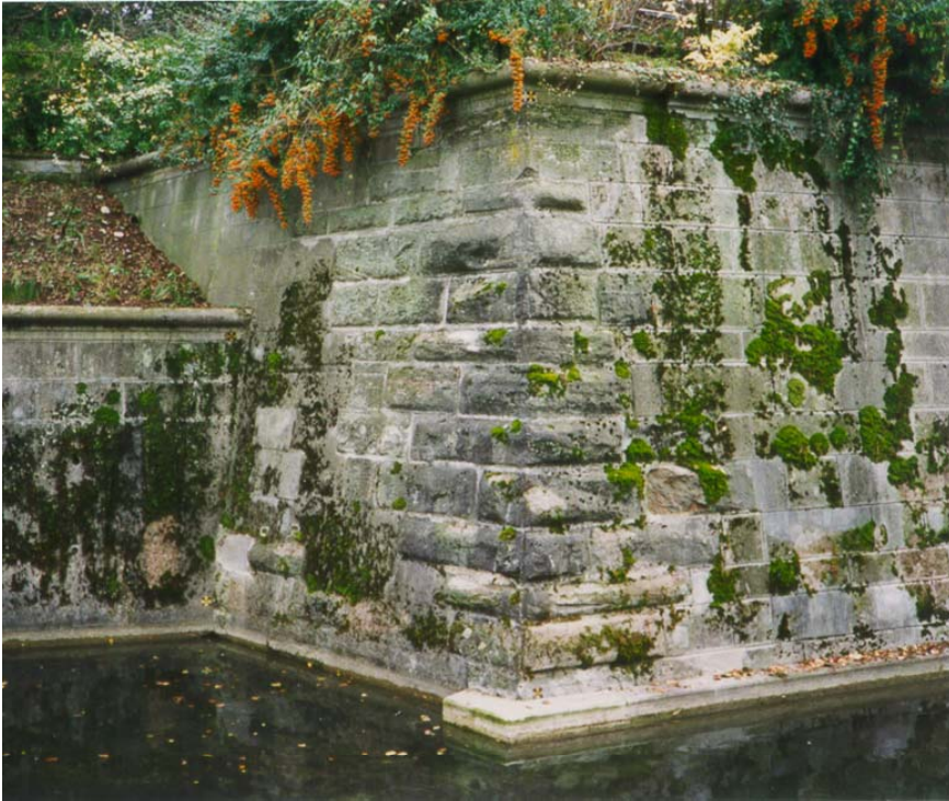
Schanzenmauer, sanft sanierter Eckpfeiler