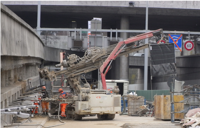
Wandverkleidung (Betonelemente) entfernt, Einbau der Ersatzanker